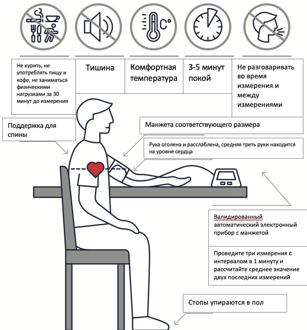
Рисунок 2. Методология измерения ОАД